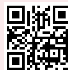
APP "CAUDIEL EN TU MANO"